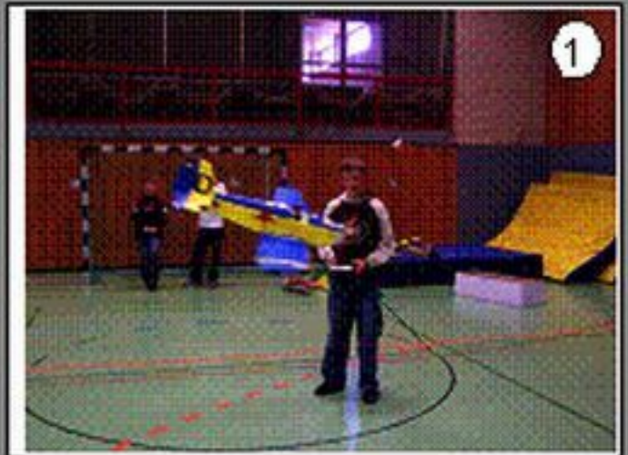
Fliegen in der Turnhalle

Das Projekt kann die erfahrenen Modellflieger und die jugendlichen Anfänger zusammenbringen.