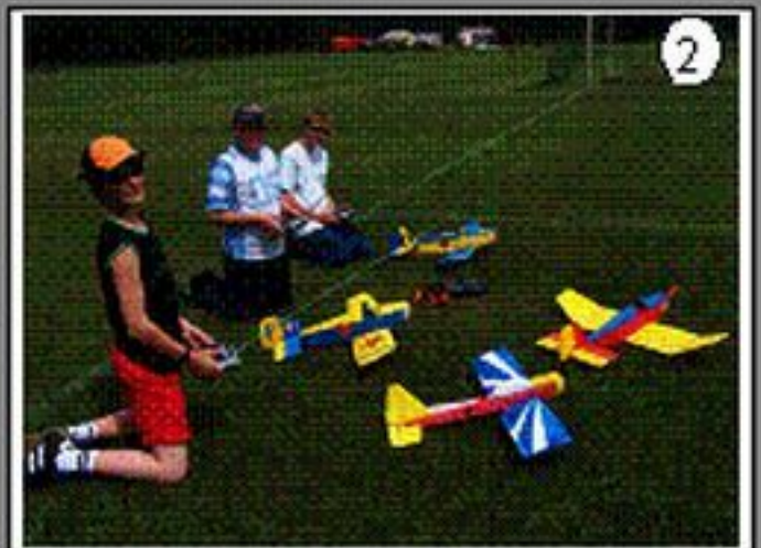
Fliegen auf dem Sportplatz